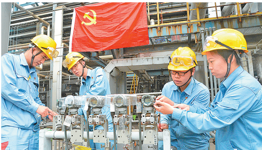
主题教育开展以来,石家庄炼化深入开展调查研究,聚焦基层一线重点难点,明确试产新国标指标戊烷发泡剂、低硫焦生产等23项技术攻关课题,全力在破解难题中夯实高质量发展根基。图为电气仪表中心技术骨干在现场攻关,破解生产难题。 支玉铭 文