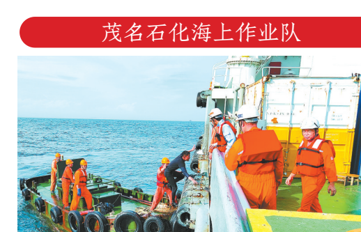
茂名石化海上作业队