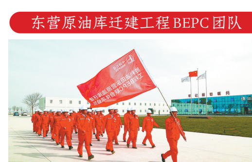
东营原油库迁建工程BEPIC团队