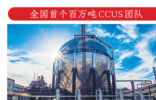
全国首个百万吨CCUS团队