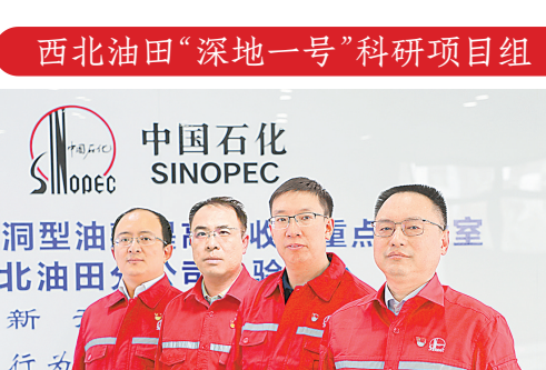
西北油田“深地一号”科研项目组