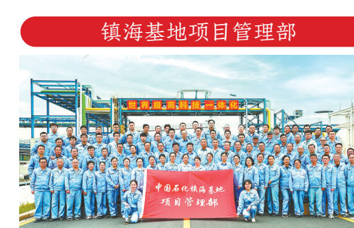
镇海基地项目管理部