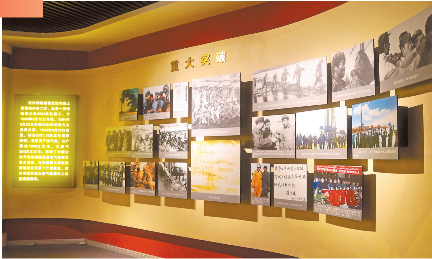
西北油田705企业文化教育基地一号展厅

教育基地展示照片180余幅、实物218件、雕塑6座、景观3处、艺术品2件,众多实物和事迹故事生动诠释了石油精神石化传统。2019年7月,教育基地被命名为西北石油局有限公司爱国主义教育基地、工业科普基地、党性教育基地。2022年8月,被集团公司党组命名为“中国石化红色教育基地”。自开馆以来,累计接待参观350场次4700人次。