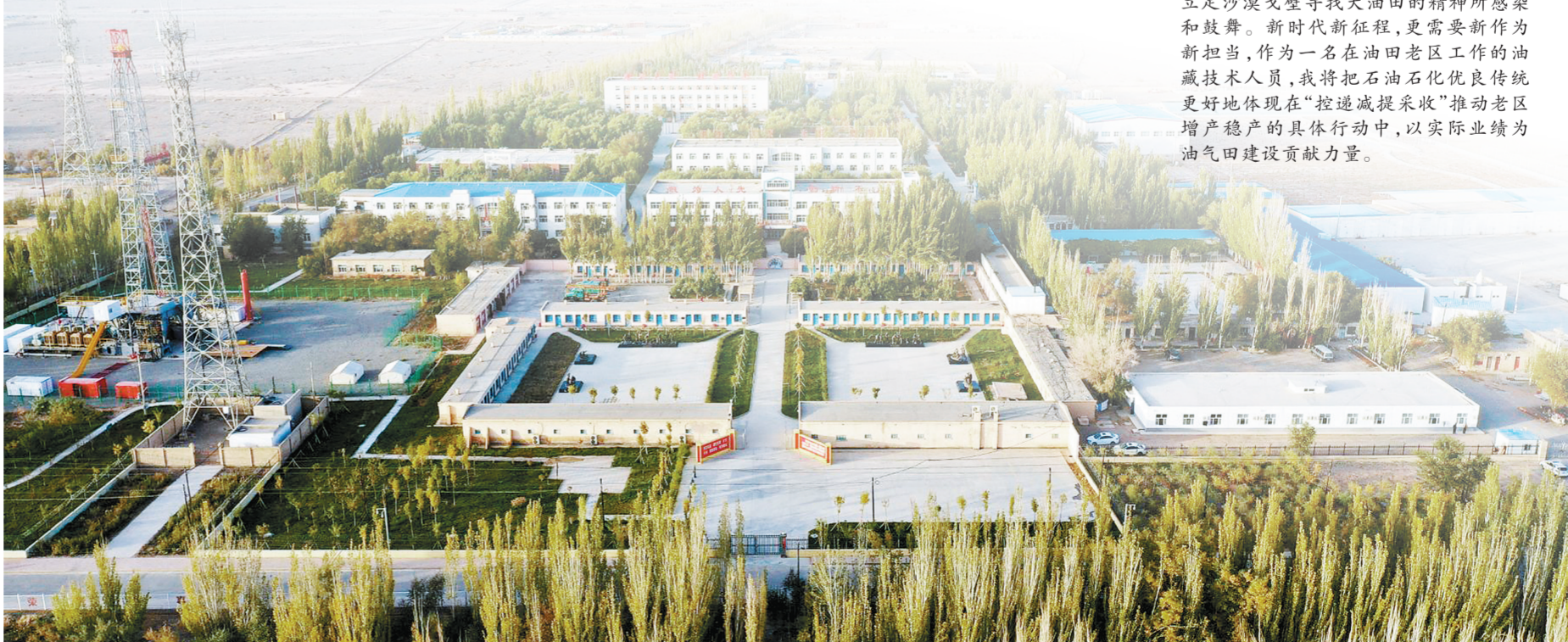
西北油田705企业文化教育基地全景

每次参观705企业文化教育基地,都有不一样的感受,深深被老一輩石油人立足沙漠戈壁寻找大油田的精神所感染和鼓舞。新时代新征程,更需要新作为的西部建设者。作为一名在油田老区工作的油藏技术人员,我将把石油石化优良传统更好地体现在“控速提采收”推动老区增产稳产的具体行动中,以实际行动为油气田建设贡献力量。