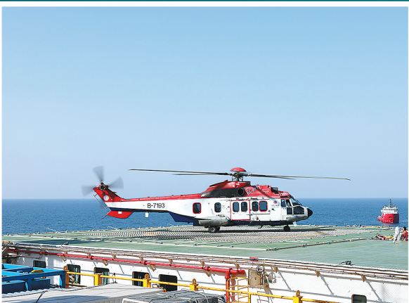
海上直升机运送员工换班。