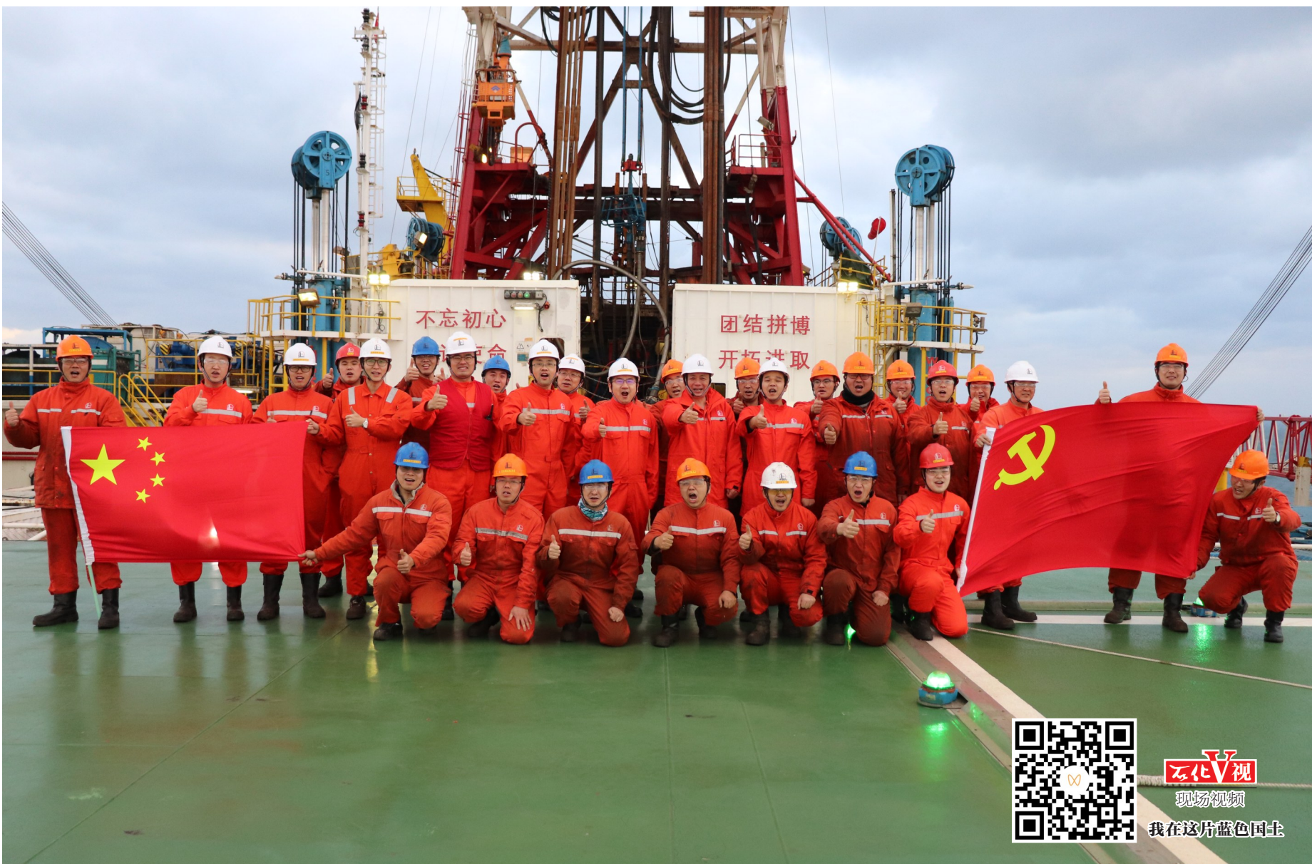
勘探四号上的员工中有忙碌的大副,有全能的钻井工,还有初上平台的设备医生,他们适应了白加黑的工作节奏。