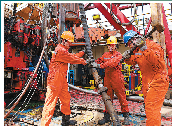
平台员工正在紧张调试试油管路。