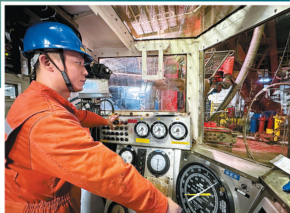
司钻聚精会神操作钻具设备。