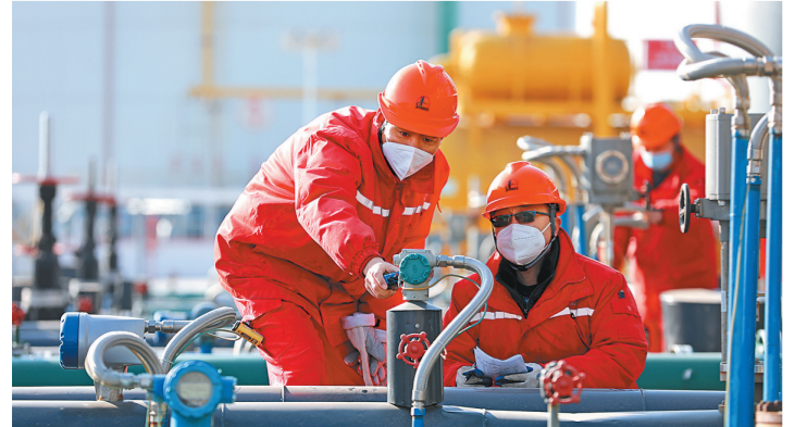
春节后,胜利油田胜利采油厂通过安全生产检查、班前安全教育等方式,扎实开展安全生产“开工第一课”活动。图为1月30日,该厂二联合站员工检查仪表。