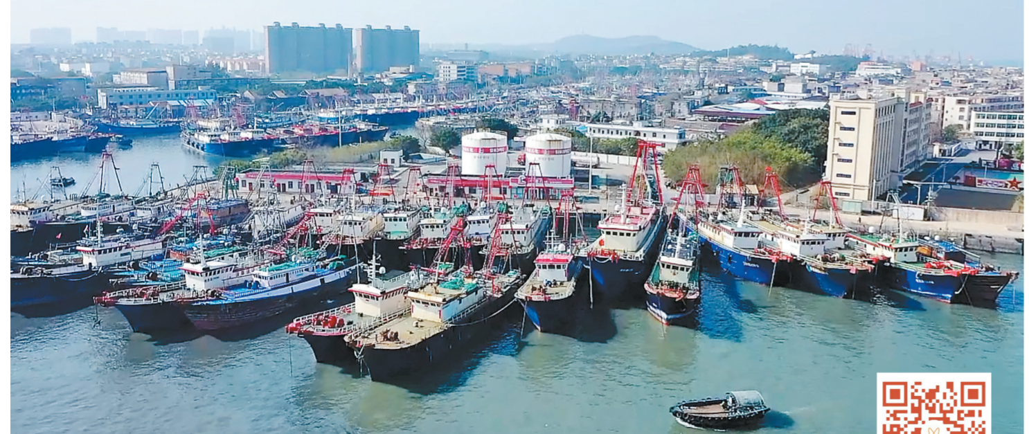
1月29日,广西北海石油海上供油中心码头一片繁忙景象,渔船陆续加油后出海作业。1月,广西北海石油海上柴油供应量创历史新高。图为渔船停靠在北海石油码头。