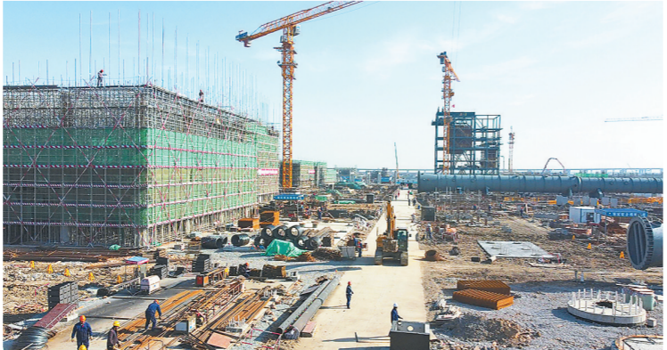
1月31日,镇海炼化工程建设现场机声隆隆、塔吊林立,建设者有序进行各项施工作业,确保项目进度。图为工程建设现场。