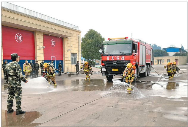
春节期间，应急救援中心队员加强实战演练。