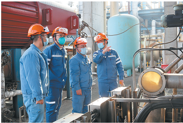
烯烃一部技术人员在装置区巡检、排查隐患。