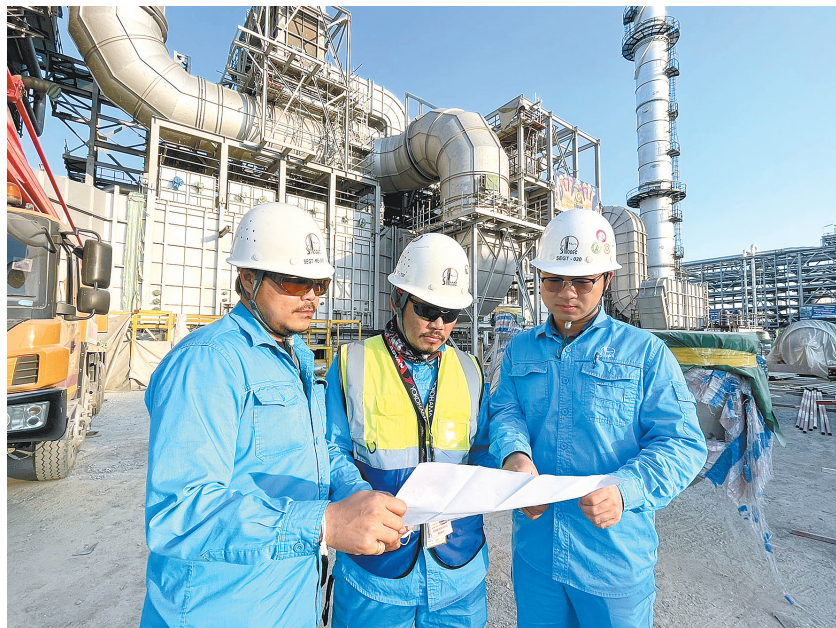
十建公司在泰国石油清洁油品项目建设中,抢抓当前降雨稀少、温度适宜的有利时机,优化施工方案,加快推进建设,确保安全、质量、进度始终受控。图为1月22日正月初一,十建公司员工(右)与泰方两名员工在施工现场共同优化设备吊装方案。