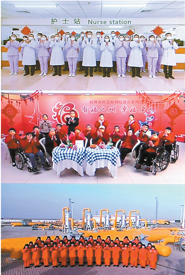
1月18日,中共中央总书记、国家主席、中央军委主席习近平在北京通过视频连线看望慰问基层干部群众,向全国各族人民致以新春的美好祝福。

习近平十分关心新冠疫情防控和患者救治工作,他首先同黑龙江省哈尔滨医科大学附属第一医院视频连线,同医护人员和住院患者亲切交流,详细询问防控措施优化调整后发热门诊接诊、重症救治、药品配备和患者康复等情况。当医院院长说“急症、重症患者数正在下降,病房、床位充足,药品准备充分”时,习近平很欣慰。接着,习近平同一名住院的老年患者亲切交流,当得知患者病情明显缓解,即将出院时,习近平祝他早日康复出院,回家欢欢喜喜过年。他指出,新冠疫情暴发以来,特别是这一波疫情来势凶猛,广大医务人员一直在防控疫情和日常治疗两线作战,长时间高强度、超负荷工作,为确保人民生命安全和身体健康作出了重大贡献。习近平代表党中央向全国广大医务工作者致以新春的祝福。他强调,近三年来,我们对新冠疫情严格实行“乙类甲管”,是正确的选择,经受了多轮病毒变异的冲击,最大限度降低了重症率和死亡率,有力保护了人民群众生命安全和身体健康,也为优化疫情防控措施、实施“乙类乙管”赢得了宝贵时间。现在疫情防控进入新阶段,依然处在吃劲的时候,但曙光就在前头,坚持就是胜利!目前,防控重心已经从防感染转移到医疗救治上来,重点是保健康、防重症,医院承担的任务更为繁重。要进一步扩充医疗资源,增加医疗服务供给,增加药品配备,特别要做好重症救治的应对准备,保障正常医疗秩序。要加强医护人员自身防护和关心关爱,确保他们身体健康。各级党委和政府要始终坚持人民至上、生命至上,坚持科学防治、精