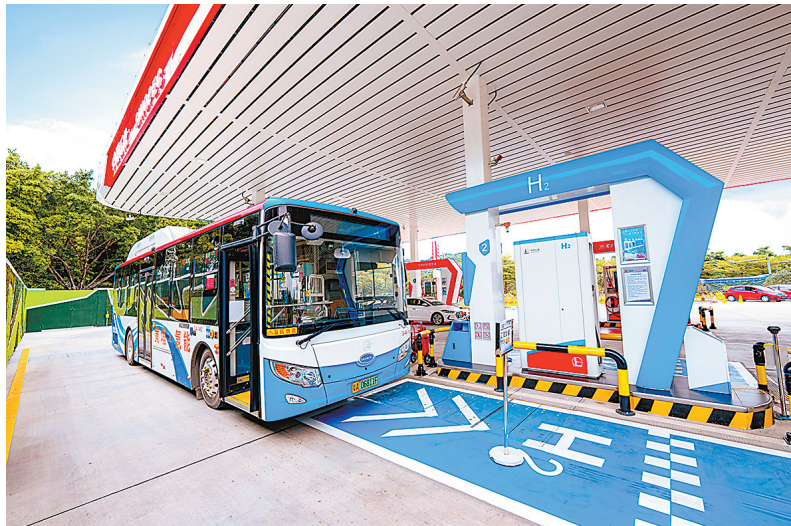
广东石油为氢燃料电池公交车供应氢气,为公共交通提供清洁能源。