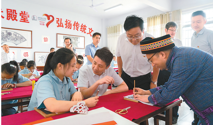
广东石油组织人员到湖南泸溪石化中学与学生交流。