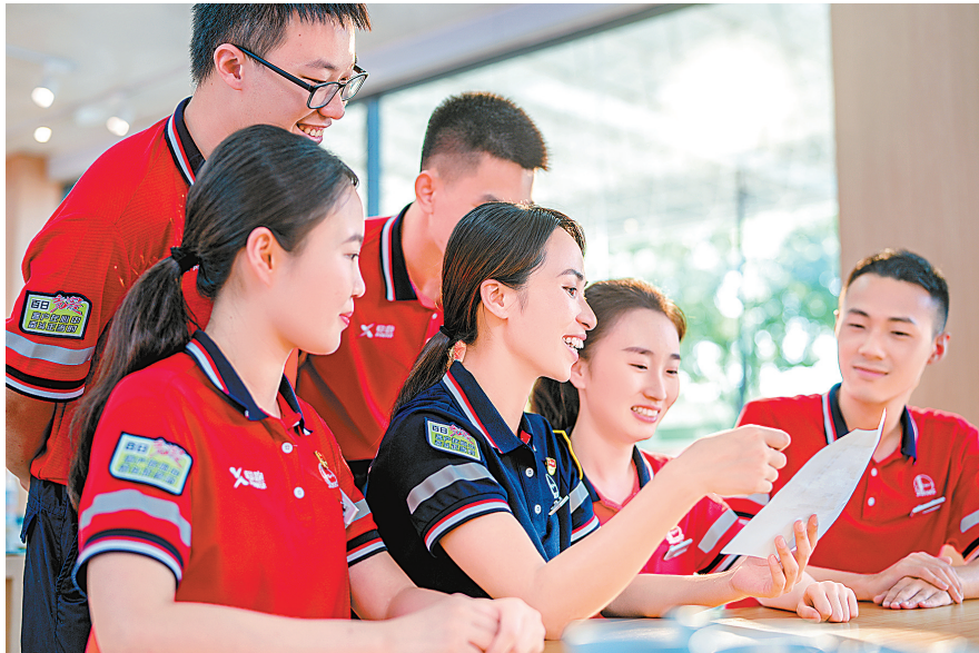
大师傅建设机制让优秀站长成为员工导师,强化队伍素质提升。