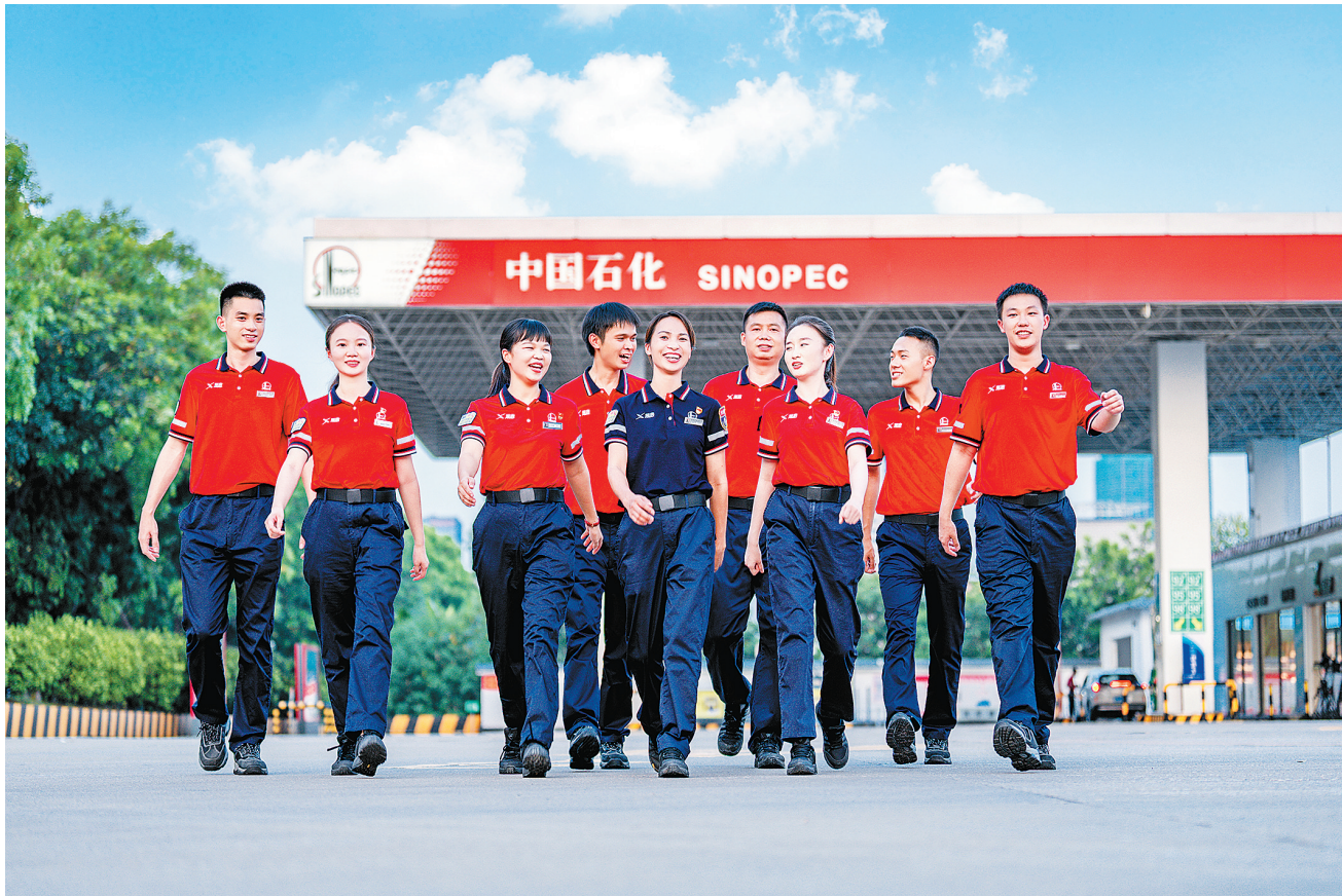
▲广东石油深挖员工内生动力,激发全员集中精力攻坚克难。

科技赋能提高内部管理效率。广东石油通过开发算法模块,开发应用系统,建设智慧经营部,开发智能订货系统,推广AI接卸油等,不仅摆脱了“人盯人”传统现场管理模式,大幅提升站库智能化效能,还通过算法模型、应用系统替代纸质台账和人工劳动,为基层减负。