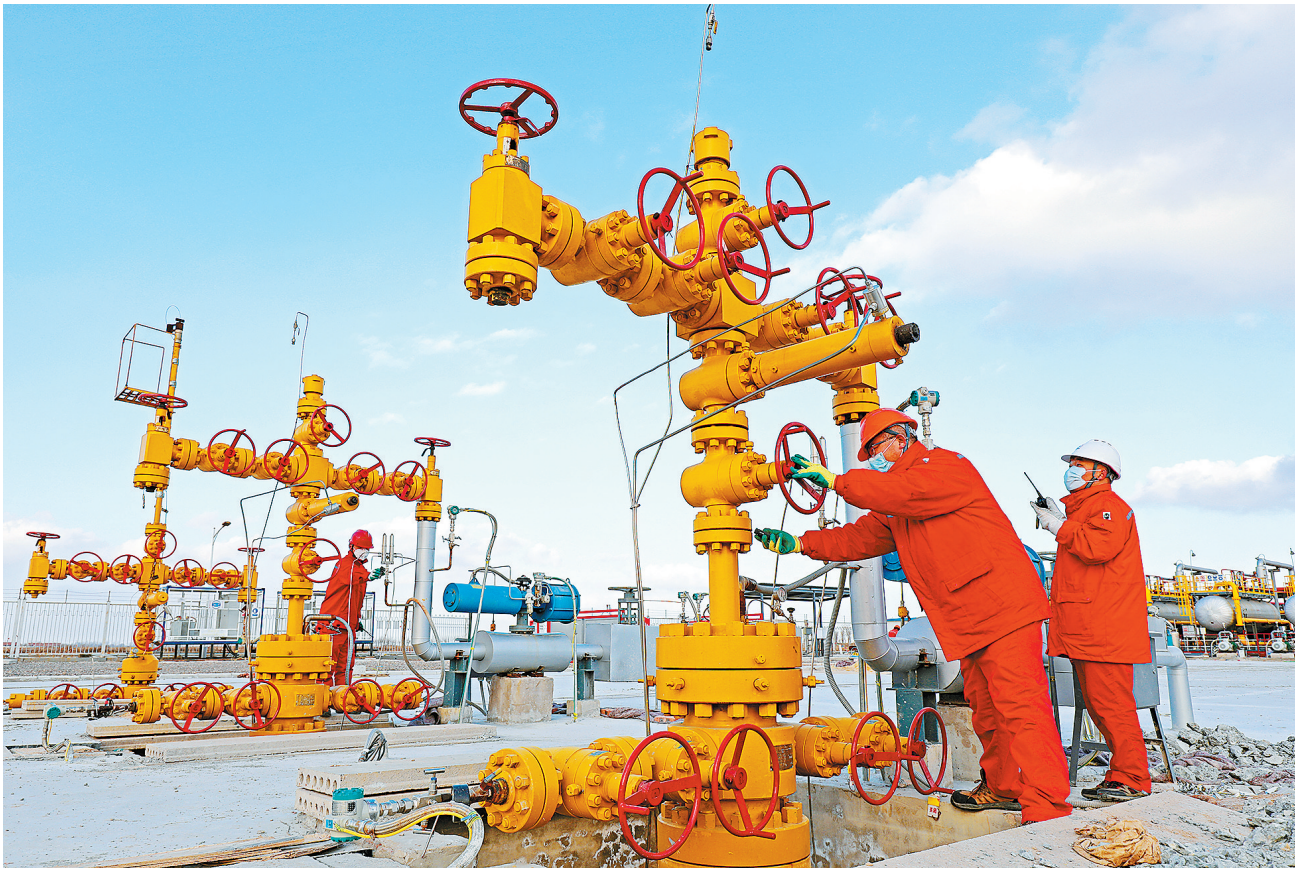
强化巡检守护冬供“粮仓”

他们持续做好公司整体氢气平衡,满足氢气新能源装置原料需求;紧抓北京冬奥用氢及北京市氢能公交车上线运营等有利时机,持续提升销量;增强装置充装能力,提升充装效率,保证氢气24小时不间断充装出厂,为北京市民绿色出行作出重要贡献。(王朝辉 向左辉 麻玥)