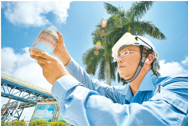
水务运行部员工认真观察水质。