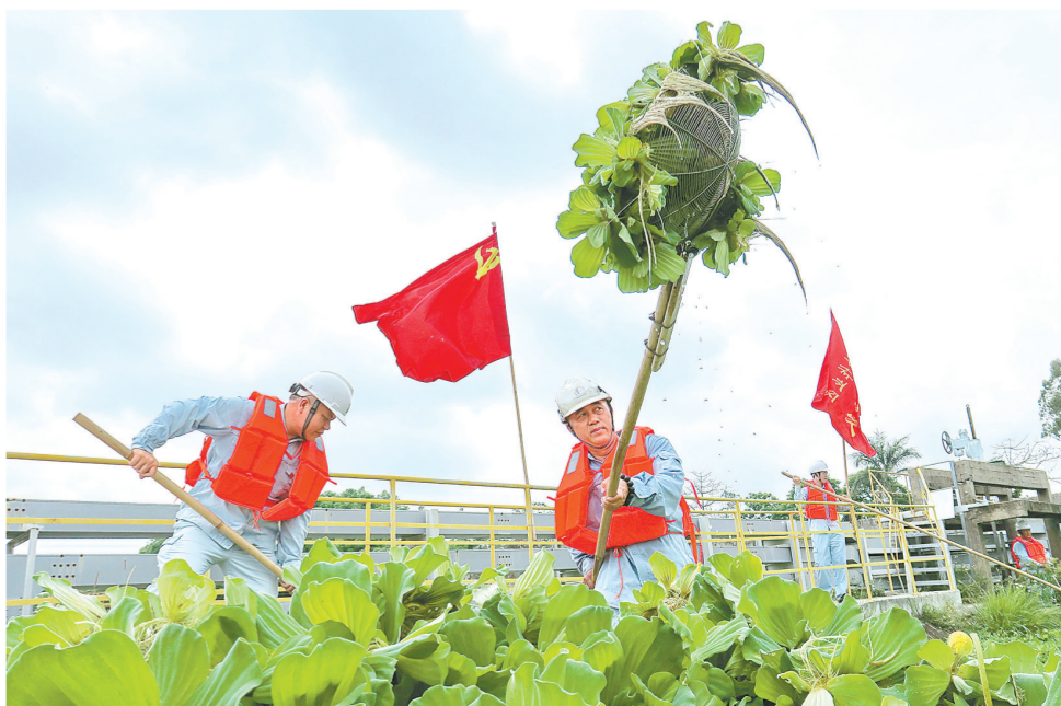
大雨过后,水务运行部组织党员突击队,协助水渠员工清理河道水浮莲和杂草。