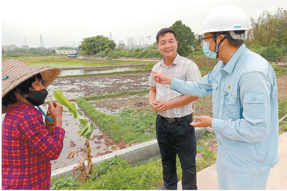
春耕时,水渠员工深入田间地头,了解水渠沿线农田的用水需求,做好水量调配。