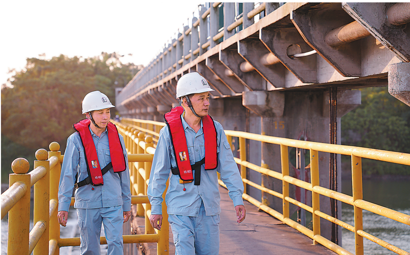
水渠员工每天沿河巡察,守护河道运行安全。