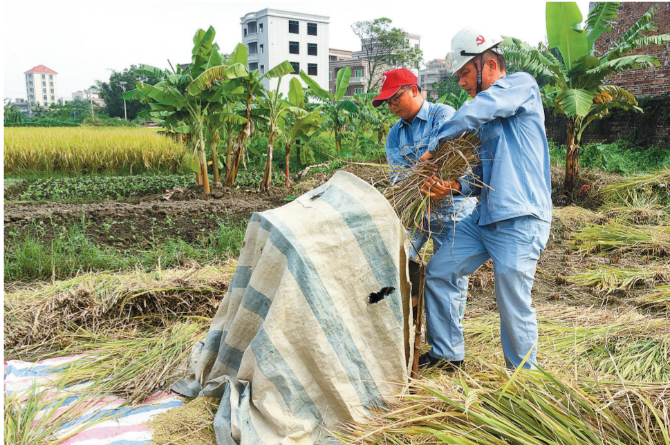
秋收时节,茂名石化助耕志愿服务队帮助水渠沿线缺少劳动力的农户干农活。