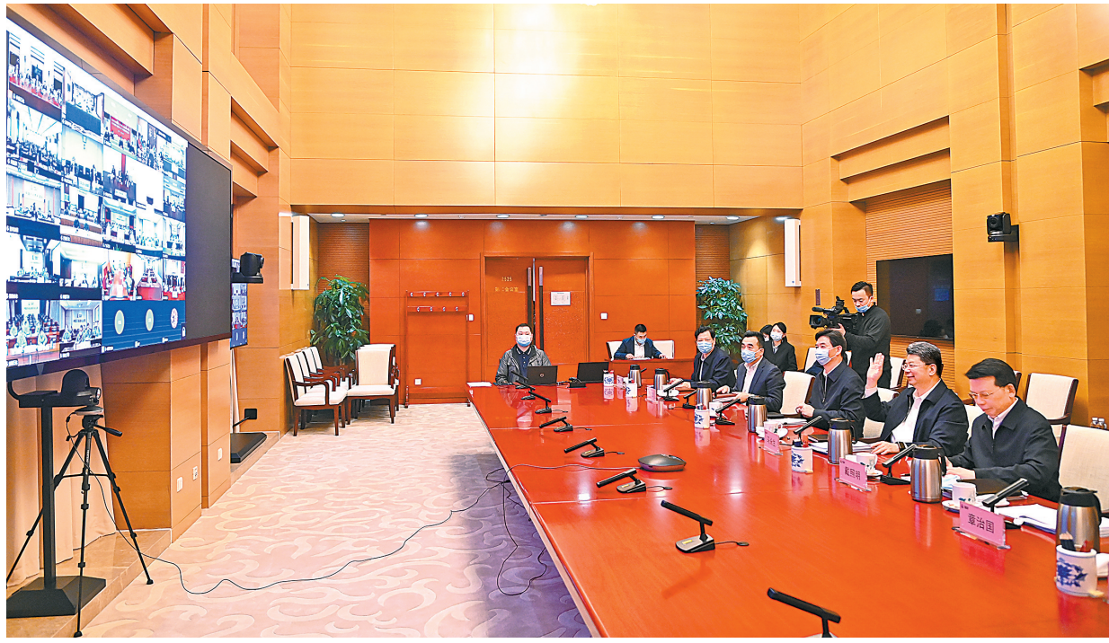
11月11日,马永生视频调研集团公司乡村振兴帮扶工作,与定点帮扶县视频连线。

马永生强调,党的二十大深刻阐述了中国特色社会主义的本质要求,对全面推进乡村振兴作出部署。党的二十大闭幕后,习近平总书记首次外出考察,再次对乡村振兴工作作出重要指示。我们要认真学习、深刻领会党的