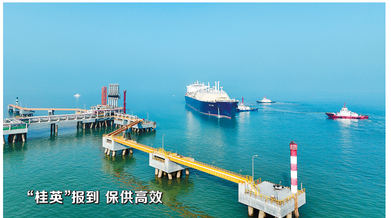
“桂英”报到 保供高效

思想在宣讲中升华,共识在宣讲中凝聚。公司领导结合实际、深入浅出的宣讲,引发干部员工强烈共鸣。大家一致表示,要以党的二十大精神为指引,凝聚干事创业的强大力量,团结奋斗、主动作为,推动石化企业高质量发展取得更大突破、更多成果,为中国式现代化贡献更大力量。