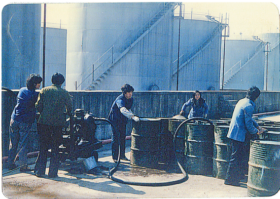
杭州石油小河油库历史照片。