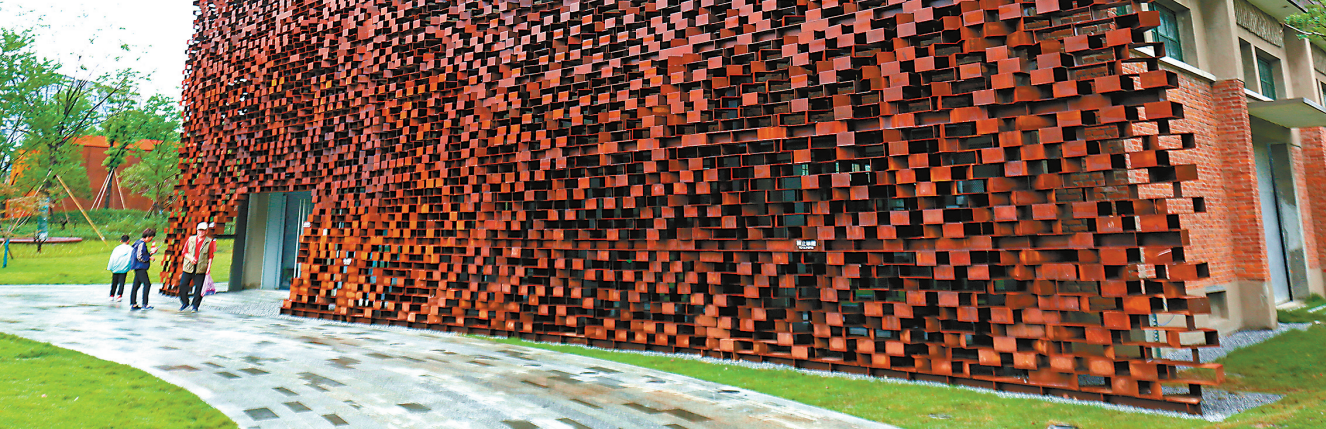
仓库外墙红砖均保留了原有的样子,在两面增加了波浪形的钢结构“表皮”,吸引市民游客打卡。

油库占地面积47750平方米,主要存储、收发柴油和润滑油。在新中国成立初期,各行各业百废待兴,油库承担了为城市能源“输血”的职责,是杭州市的老工业代表。当时,油库就像一个中转站,不仅要供应国营企业,还要供应其