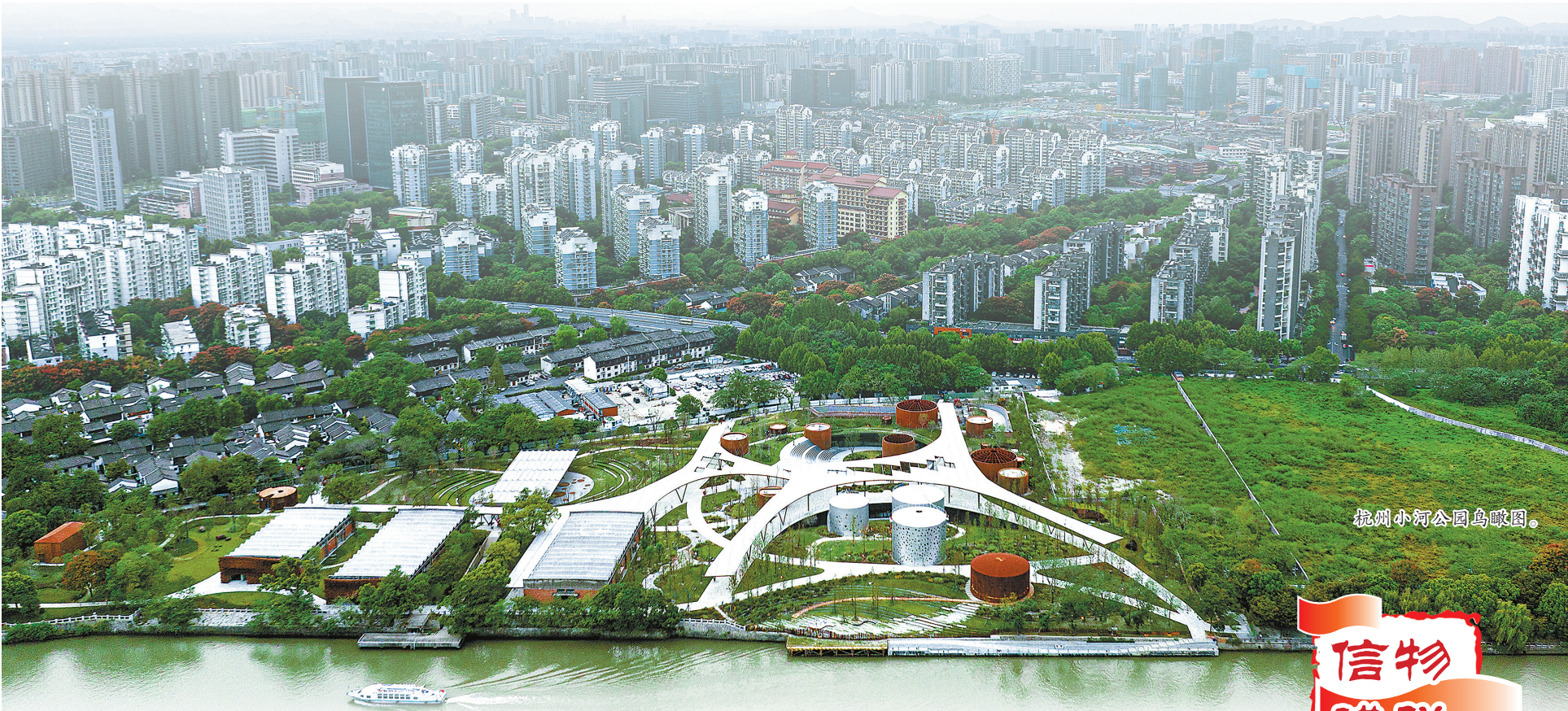
杭州小河公园鸟瞰图。