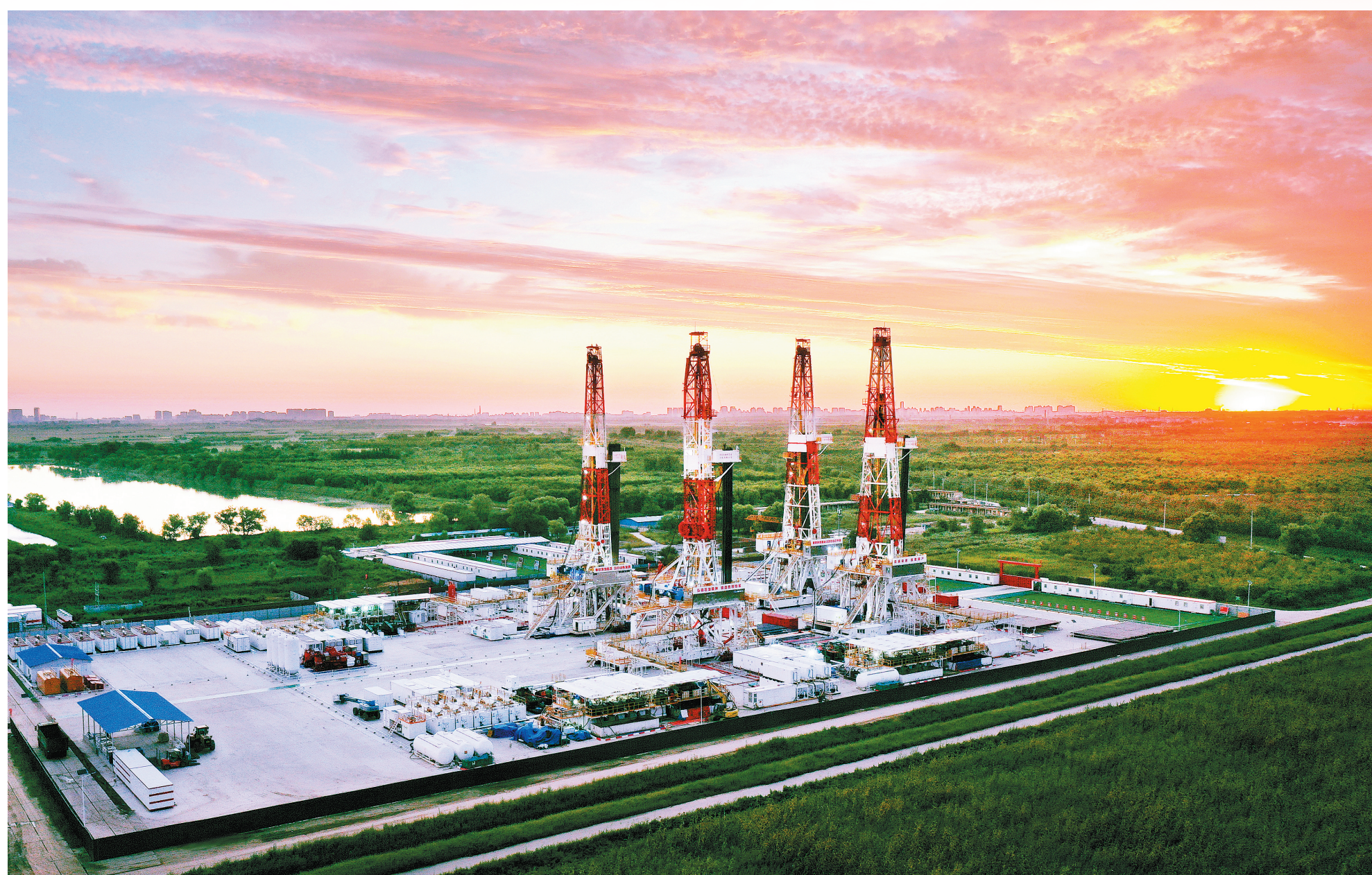
建设页岩油国家级示范区

▲胜利济阳页岩油国家级示范区重点项目牛页一区试验井组,4座巨型钻井平台上,钻机正同时进行钻井施工,唤醒“沉睡的宝藏”。