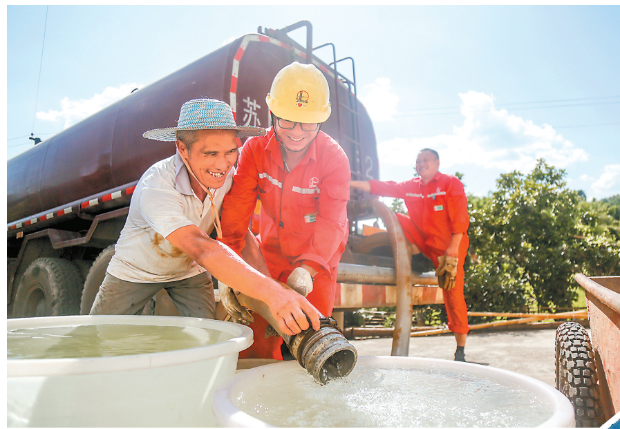
助农抗旱 送水润民心

▲今年7月以来,重庆南川区持续高温干旱,出现供水保障困难。华东石油局积极响应地方政府抗旱号召,组织人员,利用清水泵站、水罐车等,为附近老乡灌溉农田、送水上门,解稻田缺水、民众用水的“燃眉之急”。