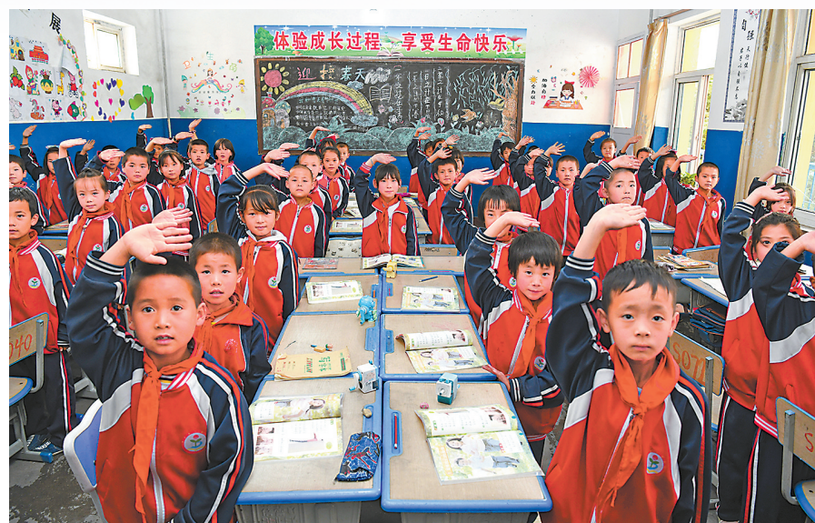
教育帮扶助力乡村振兴

按照集团公司关于乡村振兴工作的统一部署,仅任化纤与甘肃东乡耆勒乡三瑞学校结对,开展帮扶工作。帮扶工作组送去慰问品和助学金,受到学校师生的热烈欢迎和衷心感谢。