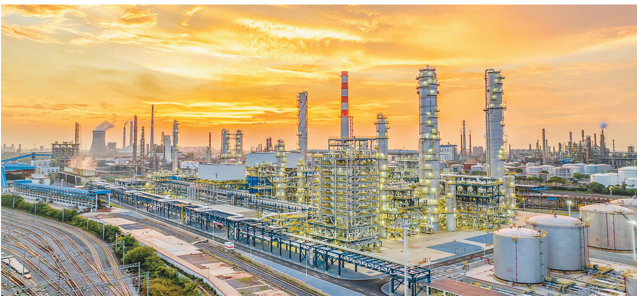
九江石化芳烃项目建成投产

作为国家产业布局的重点项目,九江石化89万吨/年芳烃联合装置投产后生产平稳,单位产品物耗及能耗低,安全性能高,将显著提升我国芳烃生产技术水平和国际竞争力。