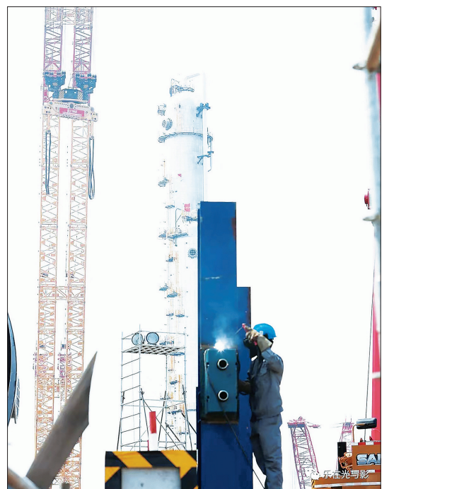
天津南港乙烯项目有序推进

天津南港乙烯项目是推进京津冀协同发展国家战略的重大工程,有11套装置采用中国石化自主知识产权的先进技术。图为项目有序推进,奏响施工建设“奋进曲”。