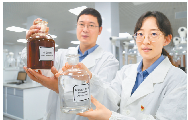
我国首批规模化生产生物航煤完成适航审定

9月13日,镇海炼化取得中国民航局审定的生物航煤适航证书,标志着中国首套生物航煤工业装置产出的首批规模化生物航煤即将飞向蓝天。