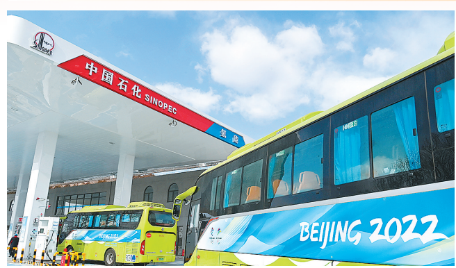
绿色氢能冬奥添动力

作为北京冬奥会官方合作伙伴,中国石化全力以赴保障冬奥会的油、气、氢等能源供应。图为冬奥赛事车辆进入北京石油兴隆油氢合建站加注氢能。