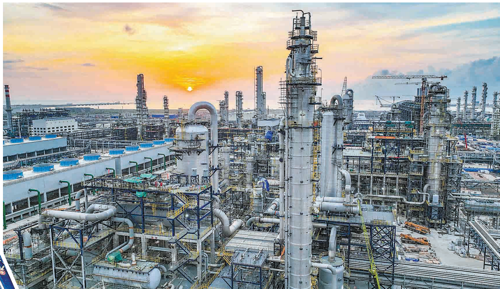
加快推进海南炼化百万吨级乙烯项目

▲海南炼化百万吨级乙烯项目及炼油改扩建项目是海南省与中国石化重点工程项目。该项目建成投产后,预计可拉动超过1000亿元下游产业。