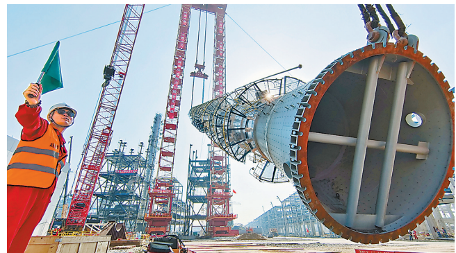
打造先进己内酰胺生产基地

为守护好一江碧水,推进企业转型发展,巴陵石化己内酰胺搬迁项目落地实施,着力打造成世界技术最先进、规模最大的己内酰胺生产基地。图为该项目最重设备吊装场景。