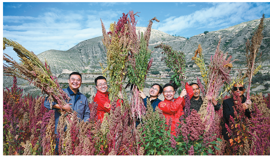
万亩藜麦“染”红田野

2022年,中国石化在甘肃东乡投入500万元帮扶资金,在10个乡镇36个村推广种植藜麦超1万亩,并打造了“育、产、加、销、研”为一体的藜麦全产业链,将带动4788户群众增收。图为中国石化帮扶干部帮助农民捆扎丰收的藜麦。