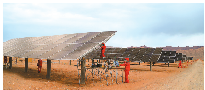
建设全球最大绿氢生产项目

新疆库车绿氢示范项目是中国石化发展氢能业务的重点工程,投产后将成为全球最大绿氢生产项目,具备2万吨/年生产规模。图为施工人员在安装太阳能板。