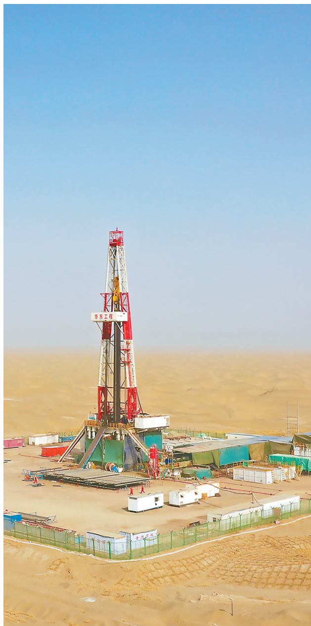
油气勘探“深地工程”获重大突破

“深地一号”——顺北深层油气田项目位于塔里木盆地中西部,储层平均埋藏深度超过7300米,是世界上最深的商业开发油气田之一。目前“深地一号”定向井井深最深达到9300米,刷新亚洲纪录。