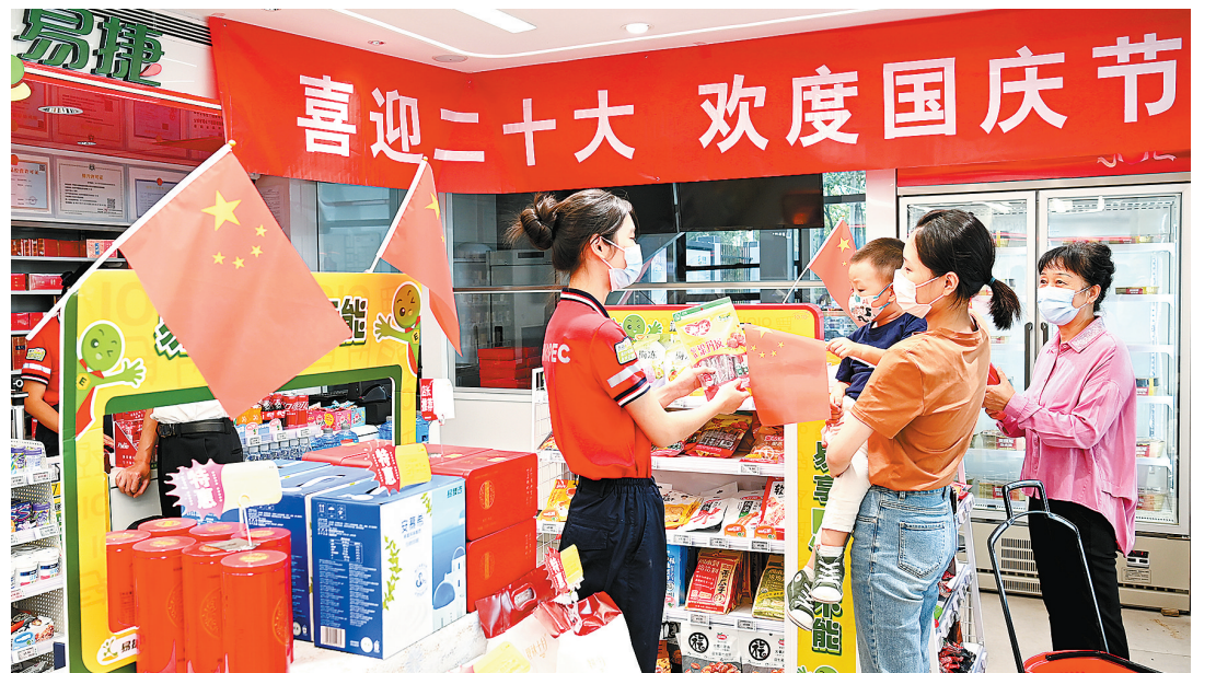
国庆节前夕,北京石油扮靓加油站,提升企业形象和服务水平,全力做好油品和易捷商品保供工作。图为9月28日,顾客在实训加油站内的易捷便利店购物。本报记者 胡庆明 摄于 慧文

甲醇与液化天然气(LNG)等燃料相比,储运更加方便,基础设施改造费用更低,具有显著的成本和安全优势,成为可行性高、碳排放少且成本低的一种船用燃料替代品种。(詹高龙 龙岩峰)