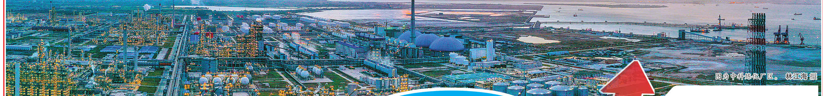
图中为中科炼化厂区。

机之家,提供休息、饮水、防暑药品等10多项服务,三伏期间,日均接待环卫工人、快递员、卡车司机等户外劳动者进站避暑1.6万人次。“中国石化发挥网点优势,为户外劳动者建设避风挡雨的温馨驿站,展示了国企为民、服务社会的担当。”广东省总工会党组书记、常务副主席陈伟东说。