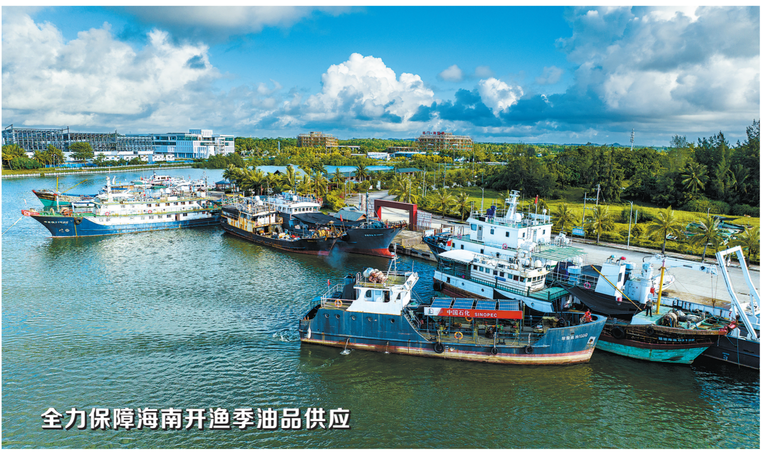
全力保障海南开渔季油品供应

下一步,安徽石油将加大与各方合作,加快拓展快递服务、线上商城等新领域业务,满足客户多样化需求。(孙德荣 周延年)