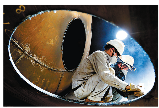
为全力做好天津南港乙烯项目设备制造,宁波工程公司的焊工(左)和柳工通力合作。