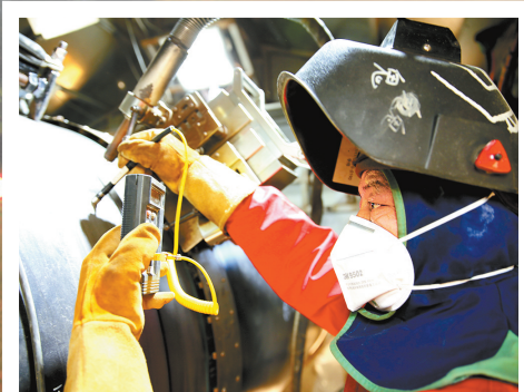
专业的焊工,要手勤、眼尖、心静。焊接前,石油工程建设公司的焊工认真测量管壁温度。