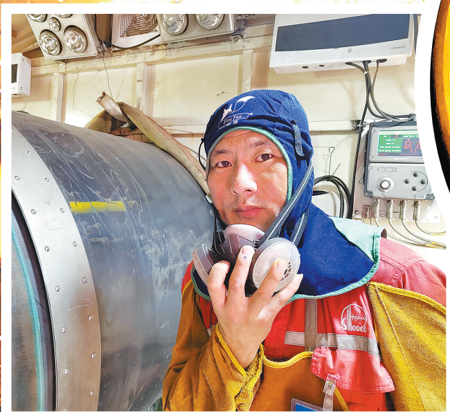
手中有团火,四季炙热无法躲。摘下防尘面罩,焊工满脸都是汗水。拍摄于西气东输三线中段(中卫-枣阳)工程第八标段。