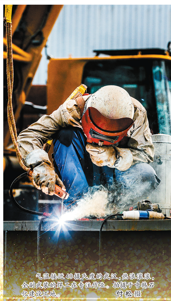
气温接近40摄氏度的武汉,热浪滚滚。全副武装的焊工在专注作业。拍摄于中韩石化建设工地。