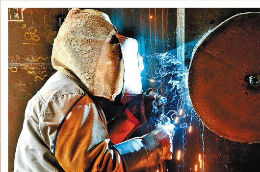
焊花褪去,烟丝成线。拍摄于宁波工程公司镇海大件码头制造车间。