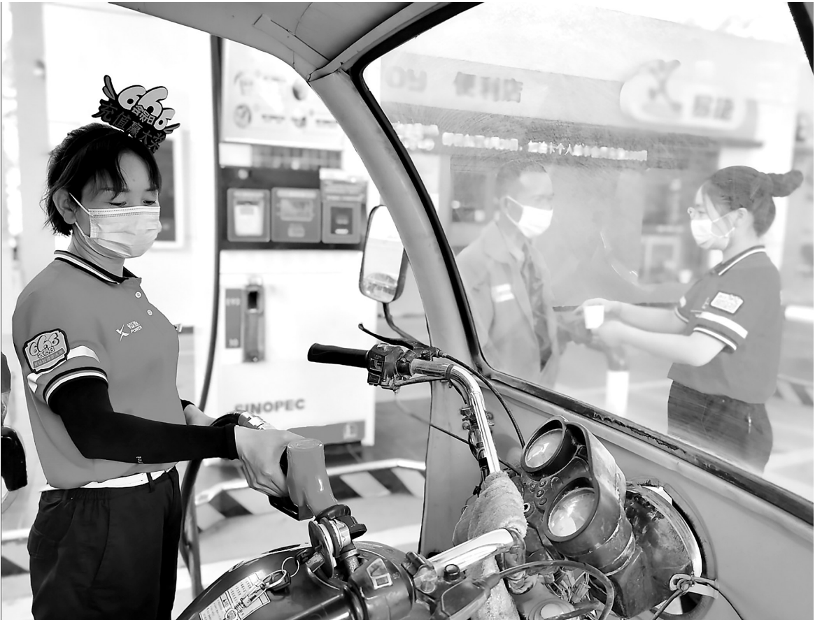
为环卫工人送清凉

架梯子、畅通道。齐鲁经营部结合该公司青年英才“朝阳工程”实施方案,精心设计基础培训、多岗实训、基本功鉴定、定向锻炼、骨干培养、组织推荐“六步成长通道”,建立青年队伍阶梯式成长机制,不断优化青年人才梯队。近两年来,3名优秀青年经过组织选拔成长为区域经理、资深客户经理,8名青年员工被纳入化销华北“朝阳工程”第二阶段培养计划,该经营部青年人才梯队层次逐渐清晰,为高质量发展储备了有生力量。