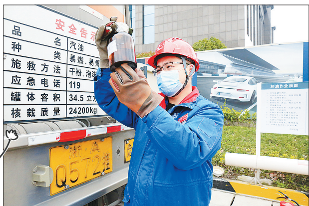
加油站工作人员检查来油油样。

随着油罐车走街串巷，我来到了有中国石化标志的加油站。与炼厂、油库的安静相比，这里车水马龙，“加油”声不绝于耳。据说，他们都是为我们而来。