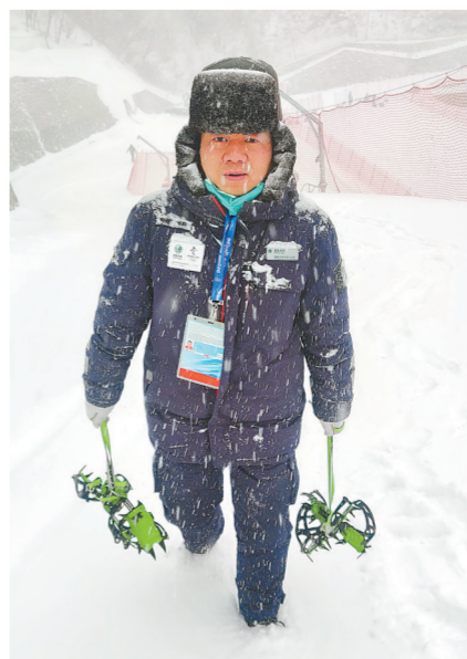
中原油田供电服务中心冬奥会保电项目员工在北京延庆高山滑雪场巡检电线。