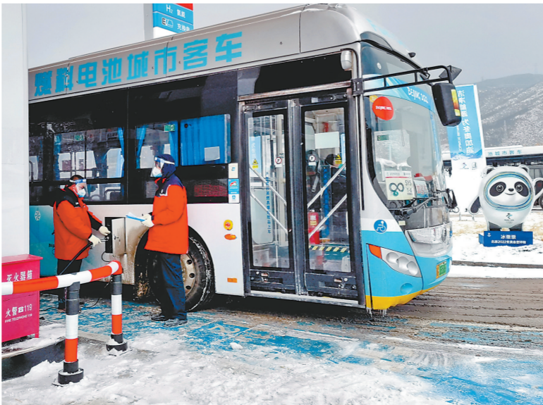
位于河北崇礼的西湾子加气站员工为冬奥会赛事用车加气。