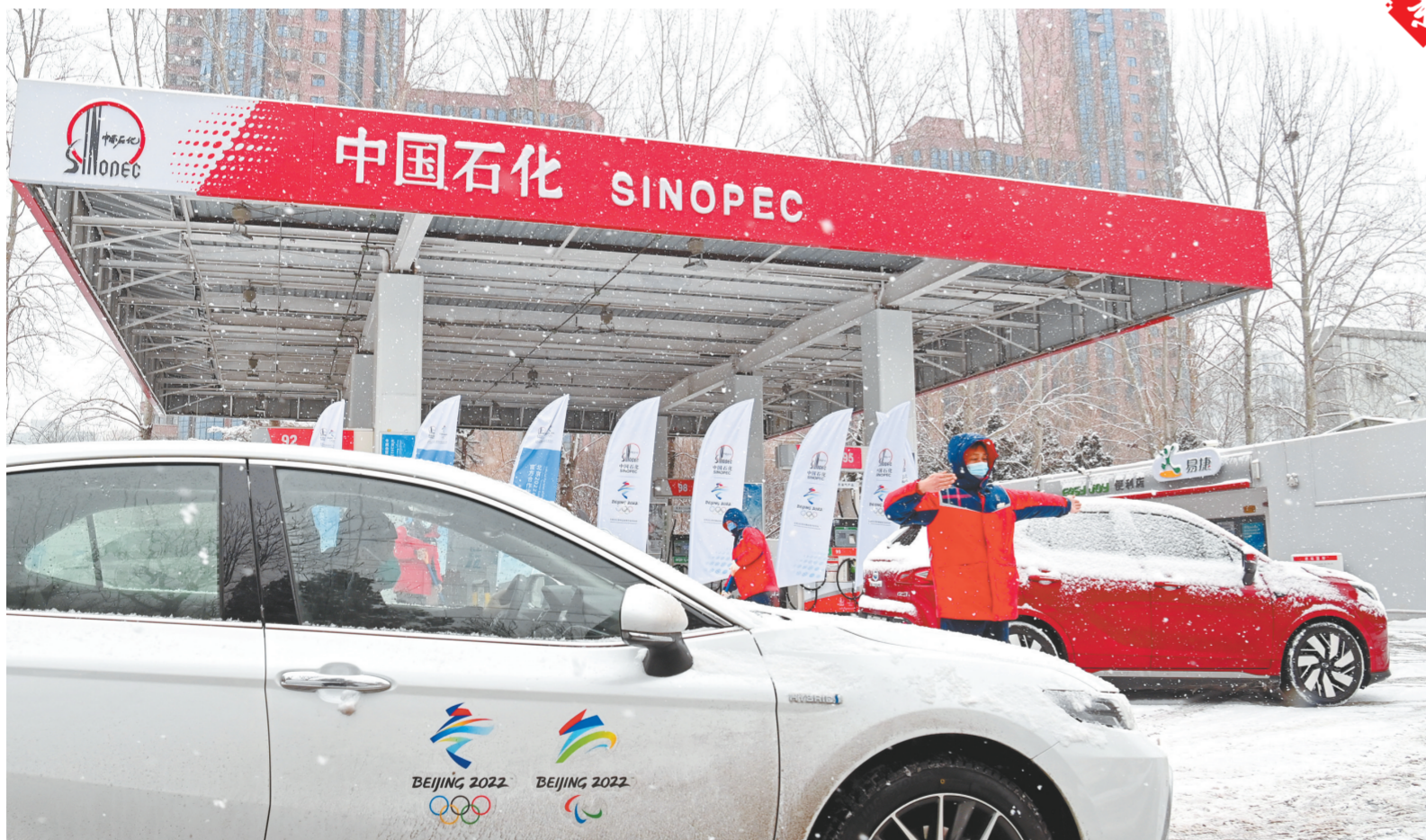
北京石油冬奥会保供站——惠忠寺加油站员工引导冬奥会车辆加油。

江苏石油开展拉网式、网格化市场调研,在摸清客户需求的基础上,明确客户经理开发责任,针对客户差异化需求开展针对性营销,为客户提供定制化供气方案,不断做大LNG终端客户数量。通过增值服务提升客户体验,灵活制定油气、气非、气服等专项营销政策,开展加气有礼等营销活动,完善服务配套设施,实施单站经营核算,稳定CNG市场份额。依托司机之家,为LNG卡车司机提供餐饮、热水、休息等暖心服务,提高卡车司机满意度和回头率。积极推进LNG加气走廊建设,在国省干道、物流通道等重要节点打造一批骨干网点,连点成线、织线成网,为零售拓销增量打好坚实基础。(何康)