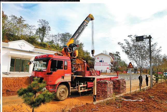
去年11月,路灯安装项目启动,这是村里的大工程。