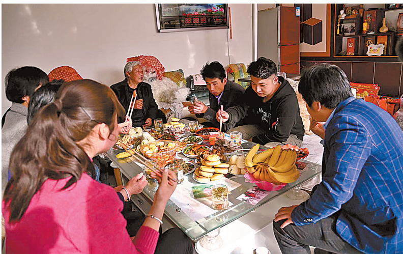
收入增加了,种植户家的团圆饭十分丰盛。