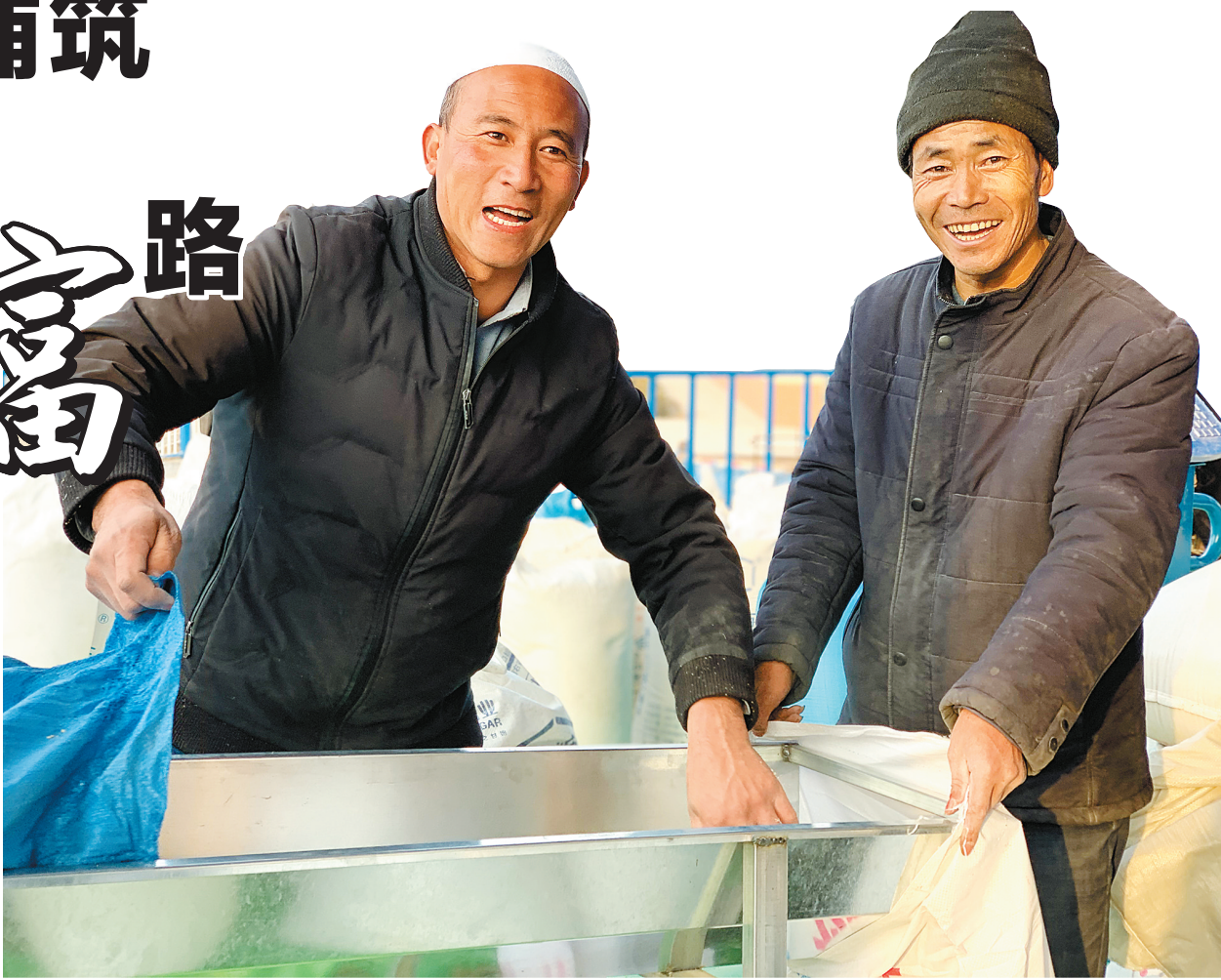
藜麦喜获丰收,加之收购价高,村民们真正尝到了种植藜麦的甜头。

“中石化是真帮咱们!”藜麦丰收“现”了,村民种植的积极性也高了,大伙儿都说,今年还要扩大种植规模,让日子过得更红火。