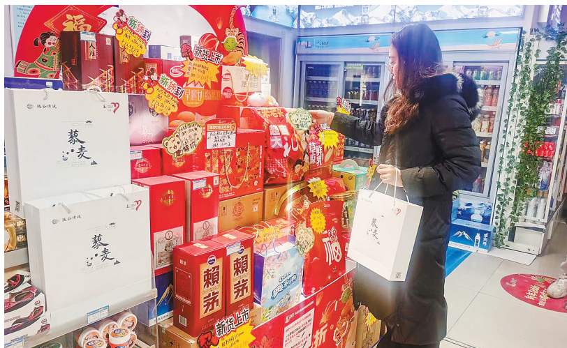
东乡藜麦销遍全国,在安徽池州石油的新区加油站里,顾客选购东乡藜麦储备年货。