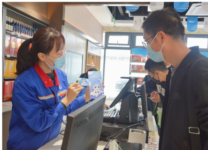
员工向客户介绍冬奥卡权益。