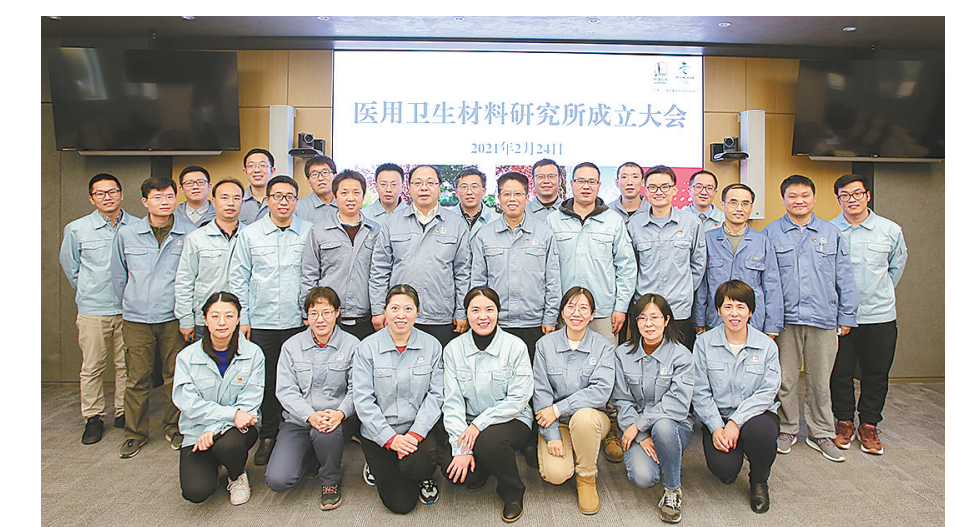
北京化工研究院医用卫生材料研究所

2021年2月,在集团公司的领导下,北化院整合院内医用卫生材料方面的技术、设备和人才,成立医用卫生材料研究所,加快医用卫生材料关键核心技术开发,满足新冠疫情常态化防控形势下的科研需求。