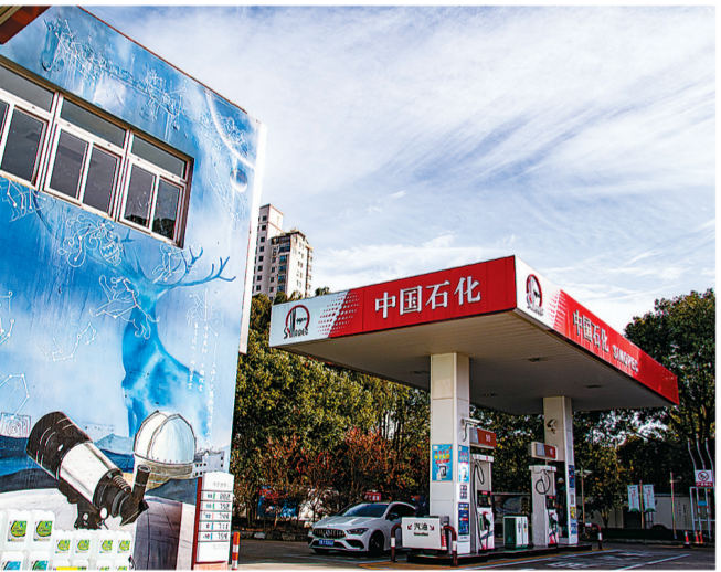
▲方东站全景。 ►方东站二楼走廊是彩绘星空文化的特色长廊。