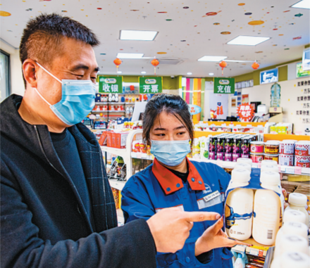
富含星空元素的便利店吸引客户打卡。

在星空文化的磁力效应下,方东加油站成为员工成才的摇篮。5年来,该站有10名员工走上管理岗位,一批批员工成长为经营管理骨干。方东加油站也成为客户最信赖的“家”。该站免费为客户提供饮用水、地图、医药箱等,设置的指示牌和业务流程指南醒目明了,正努力向着