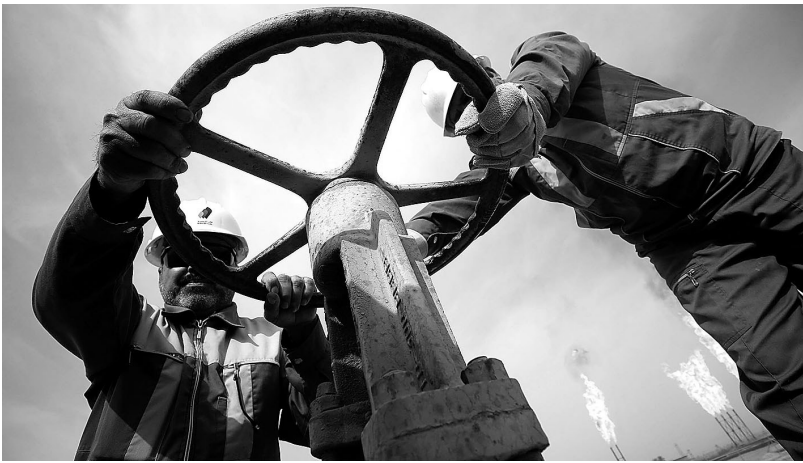
亚洲是沙特原油的主要市场。

自从沙特阿美8月确定了中东定价的总体路线后,伊拉克国家石油营销组织(SOMO)就再也没有什么动力偏离既定路线了,但其仍试图再添一些细微差别。伊拉克国家石油公司将巴士拉轻质原油和巴士拉中质原油在亚洲的售价上调80美分/桶,同时将巴士拉重质原油售价每桶上调75美分,比阿曼/迪拜原油均价低0.65美元/桶,以减轻对原油市场的