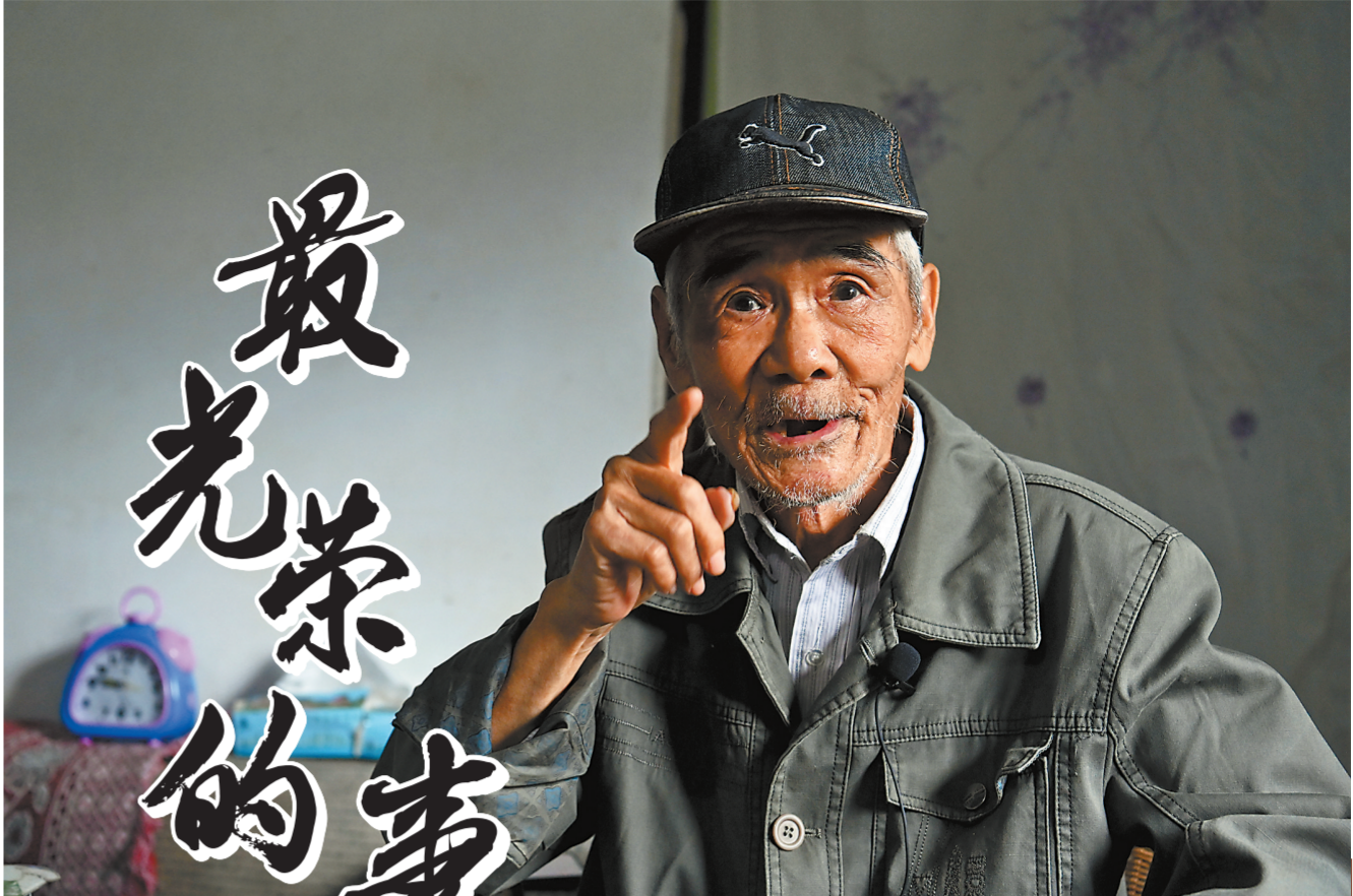
讲起当年的战争场景,周朝阁老人目光如炬,慷慨激昂。