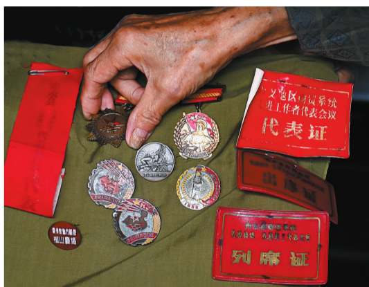
这些纪念章和红色凭证,是老人最宝贵的财富。

从老人家中离开后,大家站在熙熙攘攘的街道上,有种恍如隔世的感觉。听到的历史和故事留在了身后那栋老居民楼里,也会永远留在大家的心里。或许,这就是“传承”的意义。