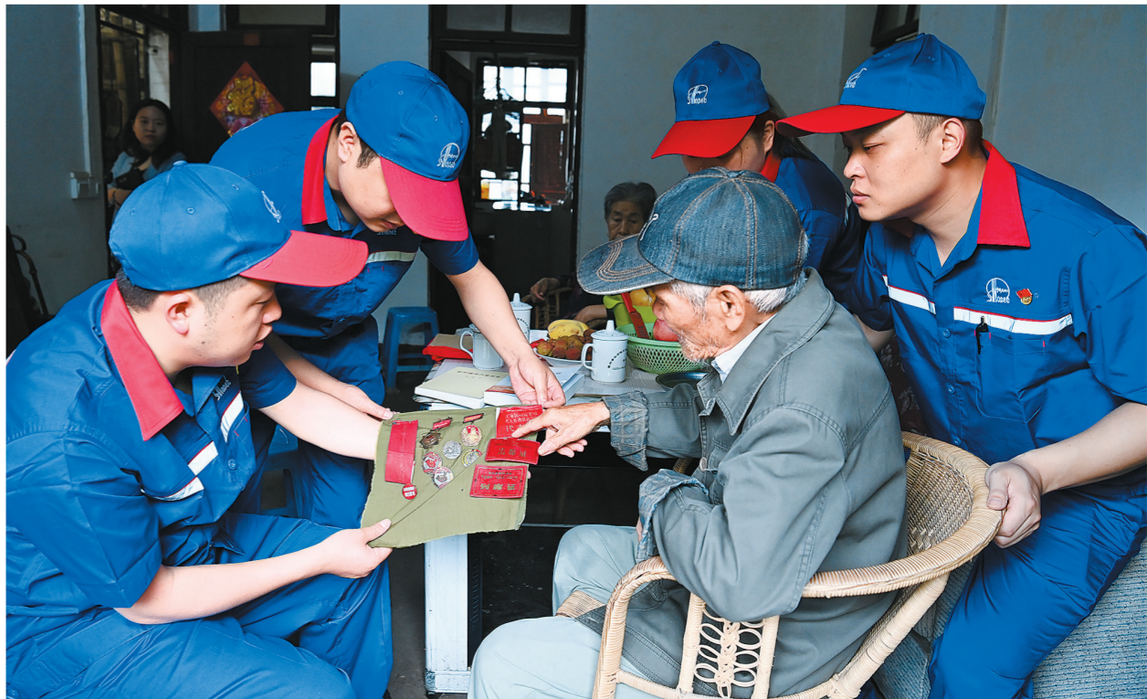
周朝阁老人向来访的员工讲解纪念章背后的故事。