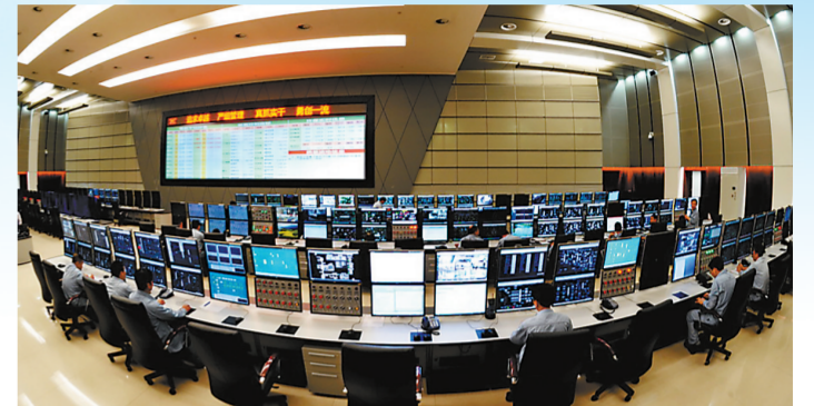
九江石化生产管控中心。

“十四五”期间,九江石化将加快推进绿色智能、炼化芳烃一体化基地建设,全面提升公司整体竞争力,实现高质量转型发展,做绿色低碳的引领者、城市生态文明的推动者、美丽中国的建设者,努力打造最美长江岸线靓丽的石化名片。