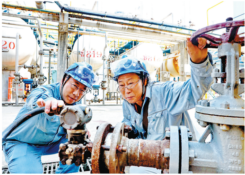
九江石化员工现场分析研究工艺。