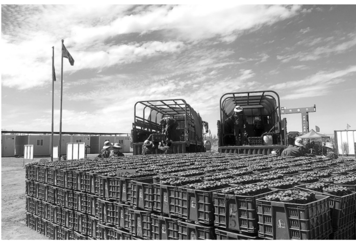
I-Nodal节点仪首次在西部沙漠进行大规模应用。