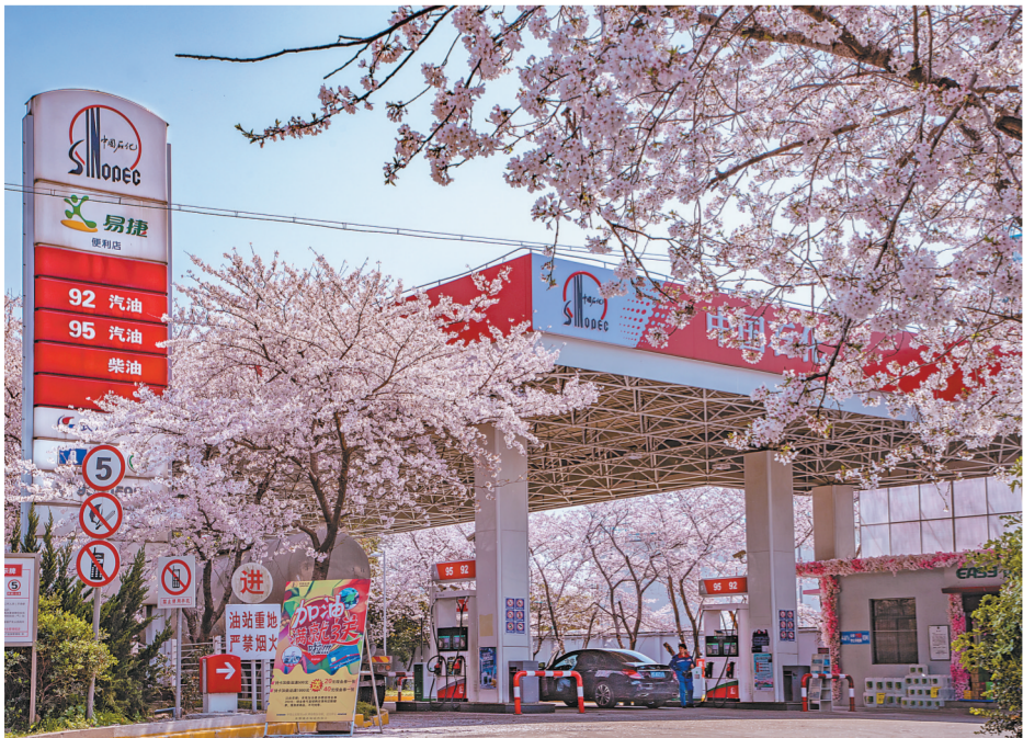
上海石油高华加油站,位于浦东北路4313号。这里樱花萦绕,粉艳的花朵映衬着大红的中国石化标识,尽显无限春光。

于是,在烈日下,樱花树会尽力伸长枝丫,挡住落在员工头上的灼热阳光;在暴雨中,樱花树会挑起茂密的树叶,不让雨水向员工身上倾泻。 年复一年,环绕加油站的这几株樱花树愈发魁梧,每年冬去春来,总争先恐后的开出满树繁花。近看每一朵都晶莹剔透,远看繁密的花朵却能完全遮住枝干。这个时候,员工也会将便利店的门窗敞开,让春风将这些花香带进屋内。春风拂过,只消片刻,过道里、货架上、店里的角角落落都弥漫着清醇的花香。 来加油的司机,仿佛是将车辆开进了花海。在员工将洁净燃料注入车辆的时候,春风也在将花香加满。此时再看,樱花树红色的繁花掩映着加油站红底白字的招牌,在蓝天的映衬下更加鲜艳。它们仿佛挽起胳膊,与这里的人们一起,努力地守卫着一方碧水蓝天。