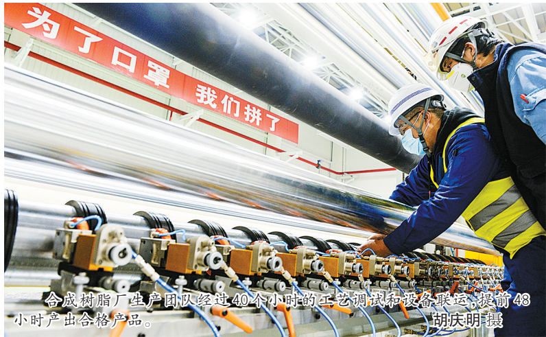
合成树脂厂生产团队经过40个小时的工艺调试和设备联运,提前48小时产出合格产品。

隔行如隔山。设备长什么样?不知道。工艺流程什么样?不清楚。 “10天交出生产线,15天产出合格产品。”铮铮誓言犹在耳畔。没别的,学!争分夺秒地学!